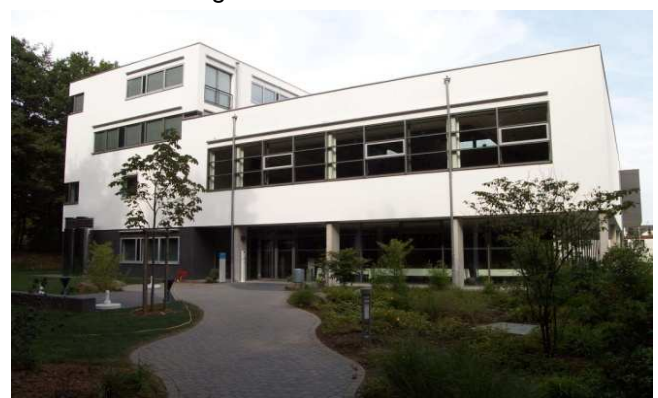
Fortbildungszentrum der Landesärztekammer Hessen

Die GIG setzt dieses zukunftsweisende System gerade in der Landesärztekammer Hessen in Bad Nauheim um. Unser Kunde spart auf Basis dieser Technologie bis zu 40 Prozent der Energiekosten.