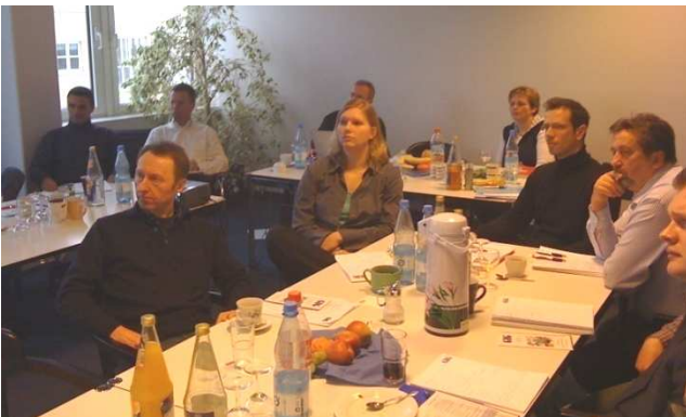
GIG-Akademie zum Thema Kundenservice