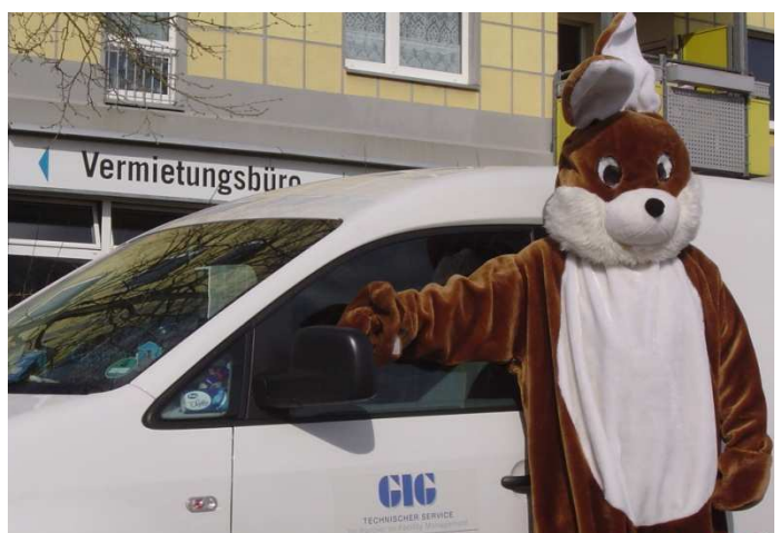
Osterüberraschung für Mieter und Kinder

Es ist schon eine lange Tradition „Ostereiersuchen durch GIG-Mitarbeiter in unserem Objekt in Hellersdorf“. Auch in diesem Jahr kam der GIG-Osterhase wieder persönlich mit vielen kleinen Geschenken für Mieter und deren Kinder. Eine gelungene Überraschung.