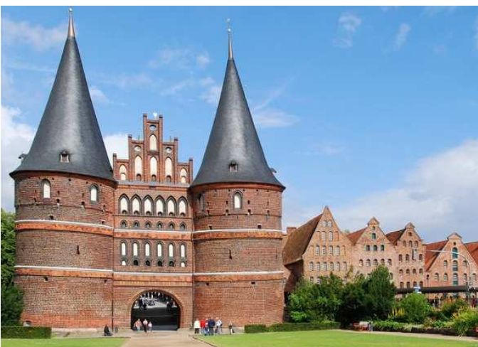
GIG-Regionalbüro Schleswig-Holstein in der Landeshauptstadt Kiel