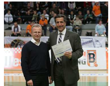
Sportförderung der GIG

Zur Unterstützung der Jugendarbeit im Volleyball-Sport überreichte Herr Hannusch einen Scheck für das Rita-Neise-Turnier des SCC Berlin. Damit möchte die GIG zur sportlichen Förderung von jungen Sportlern beitragen.